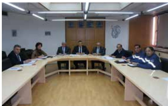
Στιγμιότυπο από τη σύσκεψη για την πρόληψη πυρκαγιών

Η σύσκεψη συγκλήθηκε με αφορμή προηγούμενη συνάντηση που διοργάνωσε το ΕΒΕ Λευκωσίας στη Βιομηχανική Ζώνη Γερίου καθώς προκύπτει σοβαρός κίνδυνος κατά την καλοκαιρινή περίοδο για πυρκαγιά και μετάδοσης της στα βιομηχανικά υποστατικά από