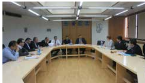
Στιγμιότυπο από τη συνάντηση

σβαση στη χρηματοδότηση, η εξωστρέφεια και οι εξαγωγές, οι κατασκευές και τα θέματα έρευνας και καινοτομίας. Κατά τη διάρκεια της συνάντησης υπήρξε ανταλλαγή απόψεων και δημιουργικός διάλογος.