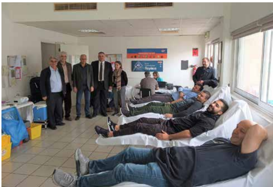
Στη φωτογραφία στιγμιότυπο από την αιμοδοσία στις εγκαταστάσεις της Εταιρείας P. & P. ICE CREAM.

Στην αιμοδοσία παρέστησαν οι κοινοτάρχες Κοκκινότριμιθιάς και Παλιομετόχου οι οποίοι δήλωσαν την στήριξη τους στον ανθρωπιστικό αυτό θεσμό. Ακολούθησε σύσκεψη στην οποία παρακάθισαν οι δύο κοινοτάρχες, ο πρόεδρος της Τοπικής Επιτροπής όπως και ο Διευθυντής Βιομηχανίας του ΕΒΕ Λευκωσίας στην οποία συζητήσαν τα τοπικά προβλήματα που επηρεάζουν τις Βιομηχανίες.