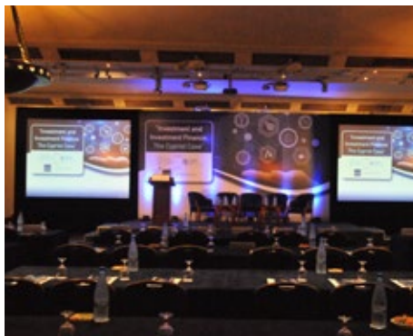
Γενικό πλάνο της εκδήλωσης