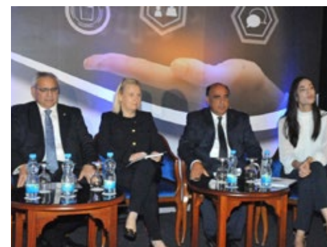
Στιγμιότυπο από το Πάνελ I

ας, Εμπορίου και Βιομηχανίας, κ. Γιώργος Λακκοτρύπης. Χορηγοί του Συνεδρίου ήταν ο οργανισμός Invest Cyprus και η εταιρεία Infocredit Group Ltd και πραγματοποιήθηκε με τη στήριξη της εταιρείας επικοινωνίας fmw financial media way ltd.