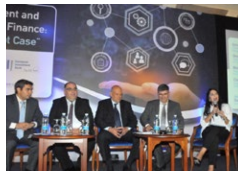
Στιγμιότυπο από το Πάνελ II

Το Συνέδριο χαιρέτισε ο Υπουργός Ενέργειας