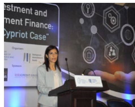
Μαρία Ηρακλέους, Εκτελεστικό Μέλος ΔΣ Κεντρικής Τράπεζας Κύπρου