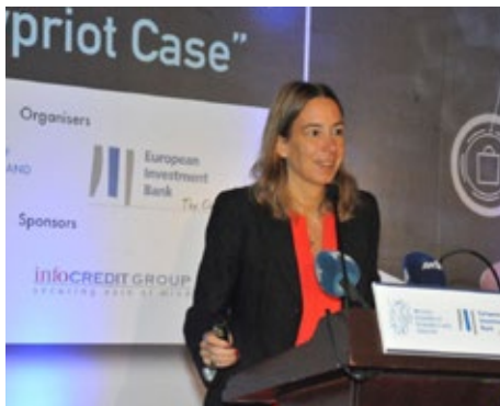
Deborah Revoltella, Επικεφαλής του Economics Department EIB

Καταξιωμένοι επαγγελμα- τίες από την Κύπρο και το εξωτερικό συζήτησαν τις νέες προκλήσεις στον χώρο των επενδύσεων και ανάπτυξης