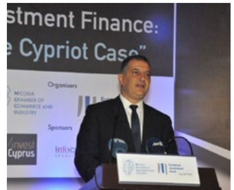
Γιώργος Λακκοτρίπης, Υπουργός Ενέργειας, Εμπορίου και Βιομηχανίας

Καταξιωμένοι επαγγελμα- τίες από την Κύπρο και το εξωτερικό συζήτησαν τις νέες προκλήσεις στον χώρο των επενδύσεων και ανάπτυξης