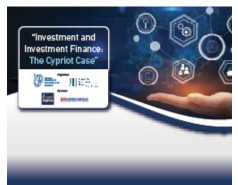
Investment and Investment Finance: The Cypriot Case